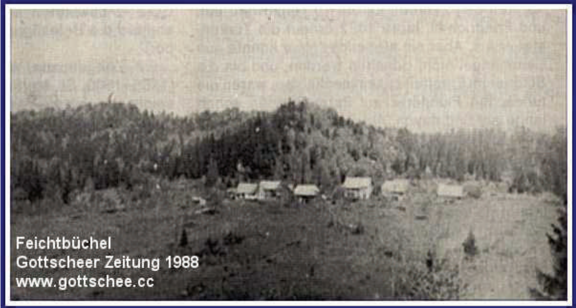
Feichtbüchel Gottscheer Zeitung 1988 www.gottschee.cc