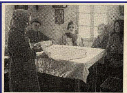
AMMO WALKT DEN WEISSEN TEIG ZU „AUSGEZOGENEN KNELLEIN“ Diese Knödel bildeten ein beliebtes Mittagsgeschicht unserer Landsleute. Über den Tisch ist das weiße Tuch ausgebreitet, die Mutter bestreut den Teig mit Mehl, bevor sie ihn zusammenrollt. Neugierig begucken die Kinder das Knödelmachen, sogar die Großmutter auf der Ofenbank sieht gerne zu