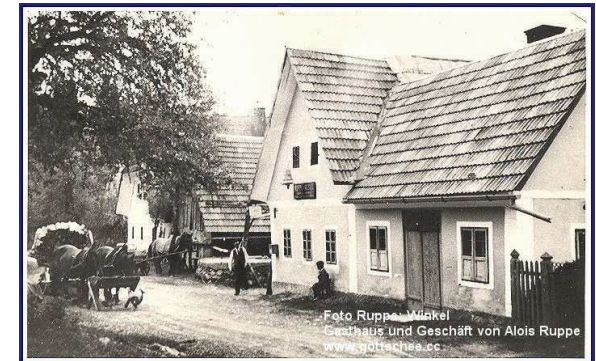
Foto Ruppe - Winkel Gasthaus und Geschäft von Alois Ruppe www.gottschee.at