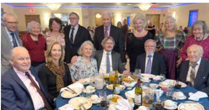
Eine wunderbare Jubiläumsfeier