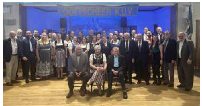
Mitglieder des KUV beim 123. Bauernball

Communications Director of the Gottscheer KUV