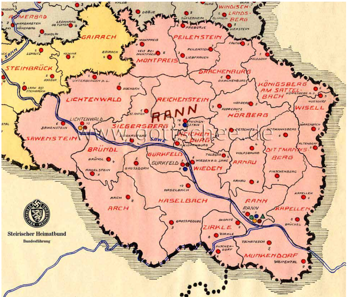
Diese Landkarte zeigt das Umsiedlungsgebiet, wo die Gottscheer im Winter 1941/42 angesiedelt wurden.