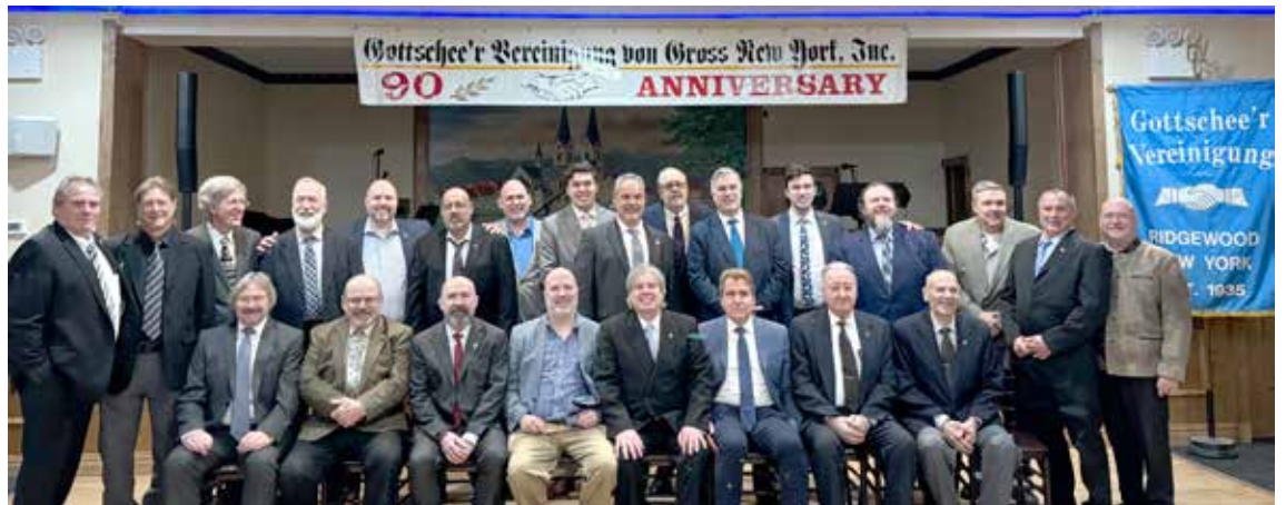
Der Vorstand der Gottscheer Vereinigung und die große Gemeinschaft der Obmänner und Vorstände der verschiedenen Gottscheer Vereine