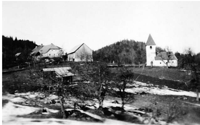
Kirche und Häuser vom Ort Steinwand in Gottschee