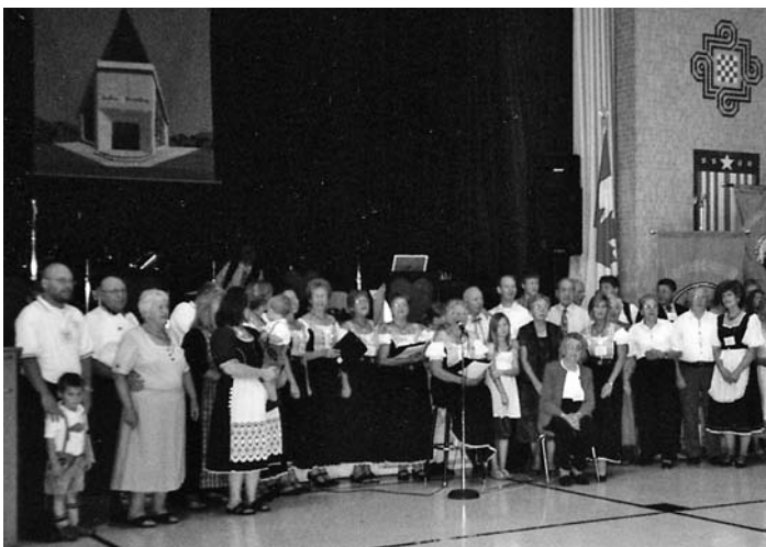
Wir sind eine große Familie. Mitarbeiter vom Gottscheer Deutscher Verein Milwaukee

Herzuben die Gäste, wobei gerne getanzt wurde und auch die Unterhaltung nicht zu kurz kam.