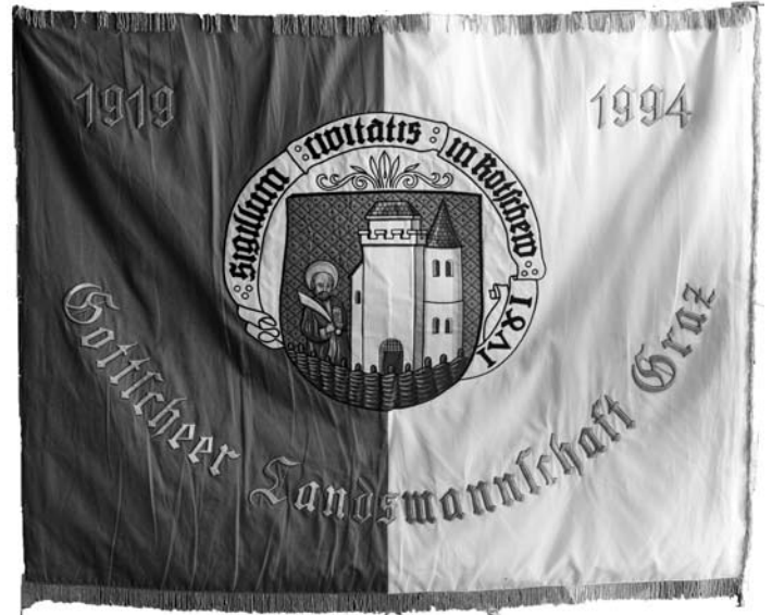
Seite der Vereinsfahne der Gottscheer Landsmannschaft in Graz