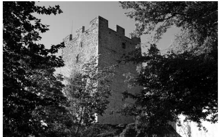
Der Friedrichsturm auf Obercilli

Die ganze Wildheit jener letzten Ritterzeit steigt aus solchem Bilde auf! – Wir erheben uns von unseren Sitzen und eilen an die Nordseite in den Trümmerhaufen des Wohngebäudes, wo ein übergroßes Fenster, das die Zeit derart ausgeweitet, den Blick auf das untenliegende Gottschee und die Berge hin bis an die Steiner Alpen schweifen lässt, die Krain von der Steiermark scheiden. Es ist August, wir lassen gerne unsere Träume über