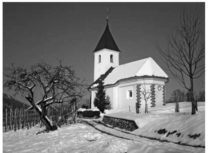
Kleinriegl – Kirche hl. Ursula