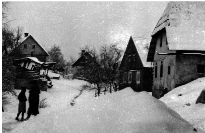
Niedertiefenbach im Winter

Damit war Weihnachten schon vor der Tür. Aber das ist eine andere Geschichte.