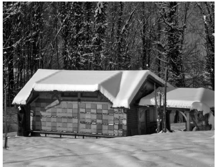
Bienenhaus in Krapflern