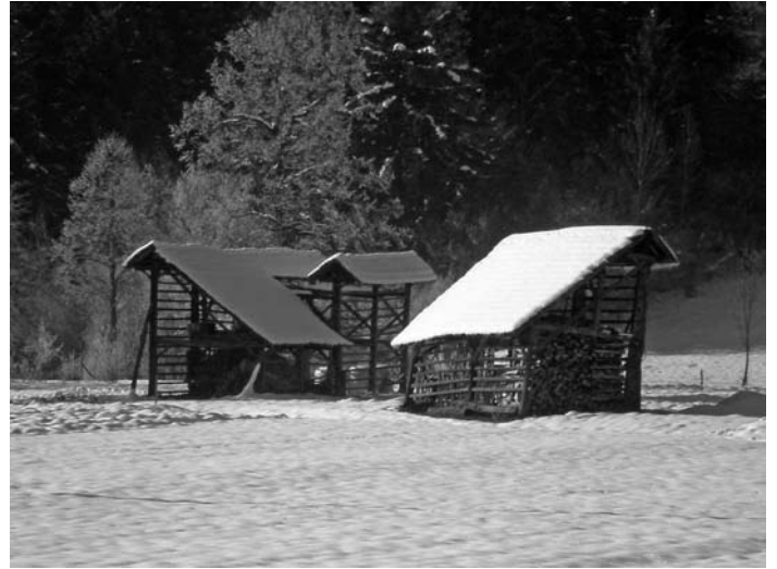
Heuharfen bei Pöllandl