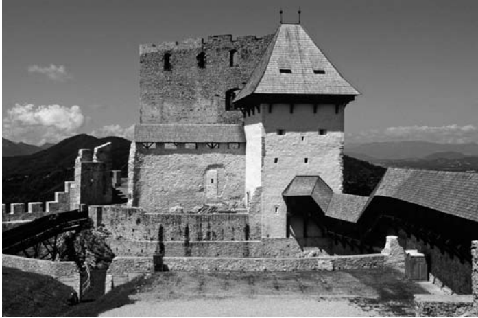
Die Burg Obercilli, Hauptsitz der Grafen von Cilli

zu umarmen, „die er allbereit im Herzen hatte.“ Dieser Verdacht ward von Friedrich's Vater und der ganzen hohen Verwandtschaft – Kaiser Sigismund miteingebegriffen – sogleich aufgefangen, „denn – schreibt der Freiherr von Valvasor – wiewohl es nichts unerhörtes, daß ein Graf sich mit einer Edeldame verheirathete, so wollten doch die Grafen von Cilli wegen ihrer Macht und Befreundung mit hohen Häusern fürstlich betrachtet sein: wie gemeinlich große Gewalt groß geachtet, und mit geringerem Stand, wenn kein besonderer Zuwachs eines Nutzens dabei ist, unbefreundet sein will.“ Da nun der Veronika Eltern nur dem Ritterstande angehörten und Friedrich ohne den Willen seines Vaters und ohne des Kaisers Beirath sie zur Frau genommen, so forderte ihn der Kaiser zu sich nach Ungarn, nahm ihn, als er