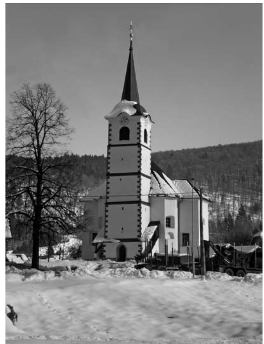
Kirche in Tschermoschnitz