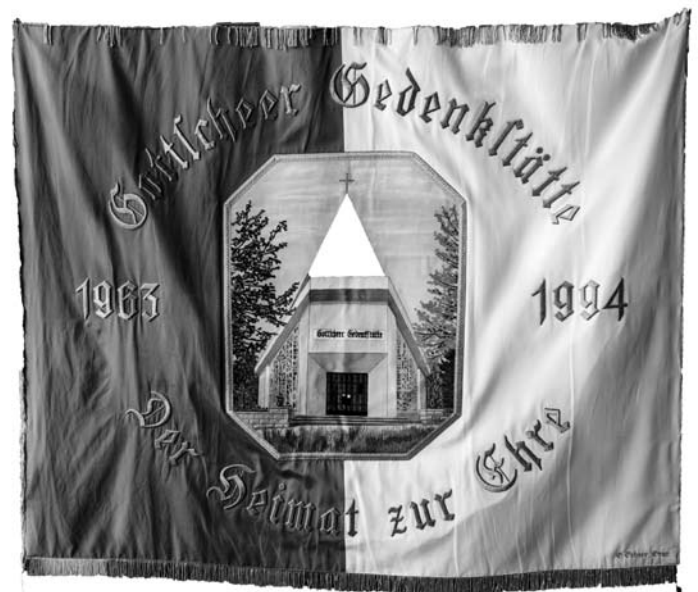
Seite der Vereinsfahne der Gottscheer Gedenkstätte