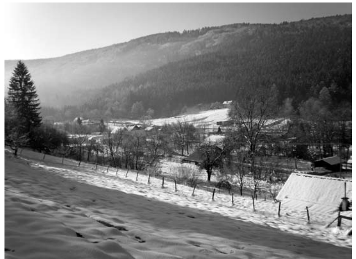
Krapflern – Altsag