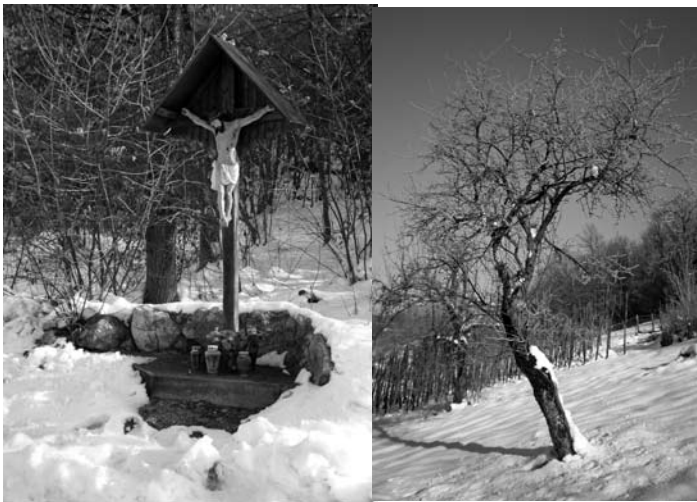
Kleinriegl - Richtung Krapfeln Baummotiv