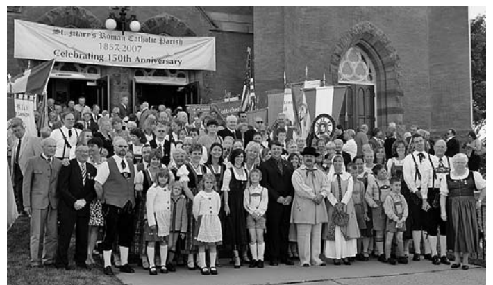
Gottscheertreffen in Kitchener 2007

Eure Spenden sind uns Beweis unserer Verbundenheit und für unsere Tätigkeit Verpflichtung !