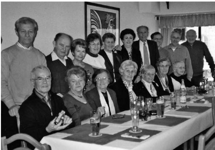
Teilnehmer der Weihnachtsfeier in München