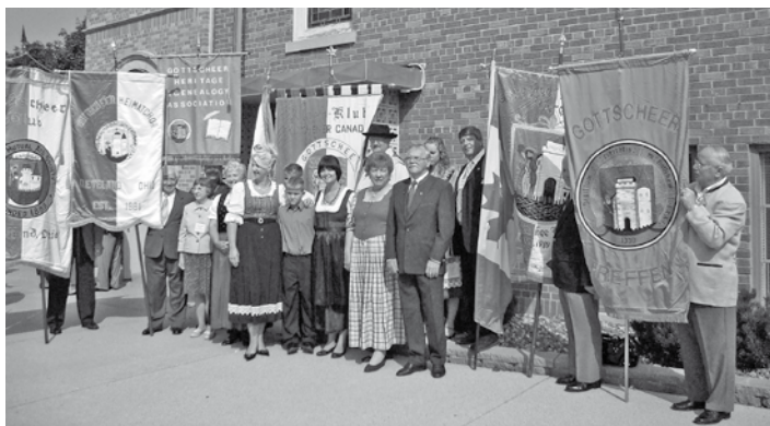
Fahnaufstellung vor der Kirche