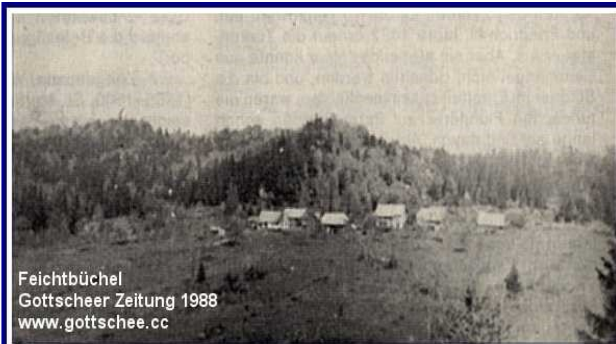
Feichtbüchel Gottscheer Zeitung 1988 www.gottschee.cc