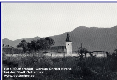
Foto H.Otterstadt: Corpus Christi Kirche bei der Stadt Gottschee www.gottschee.cc